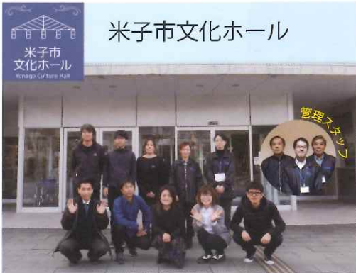
米子市文化ホール

旧年中は、米子市文化ホール、米子市公会堂、米子市淀江文化センターをご利用いただき、ありがとうございました。 本年も多くの方に安心して、気持ちよくご利用いただけますよう、職員一同努めてまいりますので、 どうぞよろしくお願いたします。