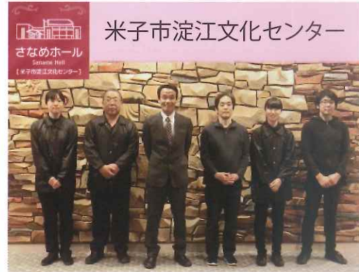
米子市淀江文化センター