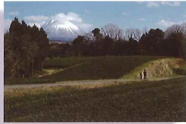
2017年一般の部 最優秀賞 「散歩」

1月18日まで募集していた「淀江の魅力再発見! フォトコンテスト」の応募作品を淀江文化センター、米子市立図書館、米子市役所淀江支所の順で巡回展示します。入場無料です。 撮影者それぞれの視点で切り取られた"よどえの魅力"をご覧ください。