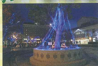
米子市文化ホール イルミネーション米子ファンタジア点灯中。