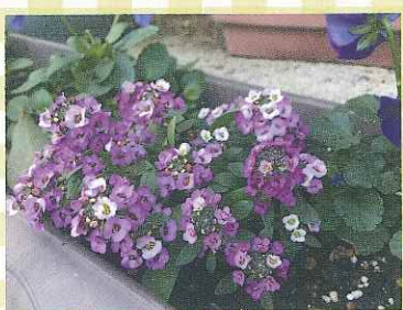
米子市公会堂 寒さに負けず大きく育てほしいです。