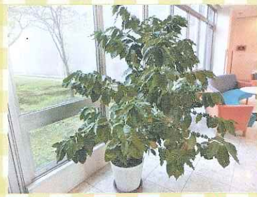
米子市淀江文化センター ホワイエにあるコーヒーの木。実が赤くなれば収穫の時期です。