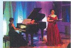
▲若手音楽家の出演時にはアドバイス等を行う。